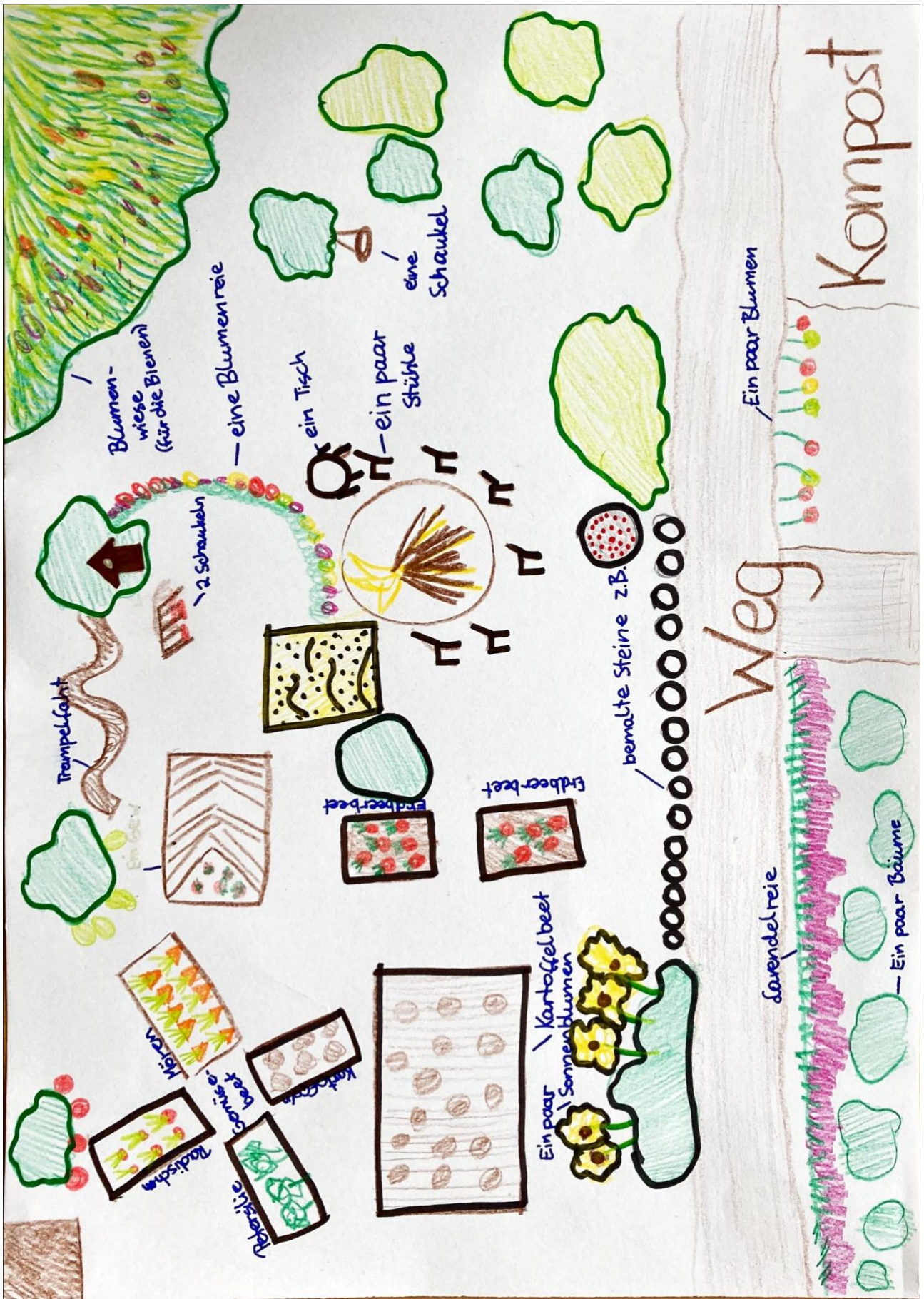
So könnte unser Schulgarten bald aussehen. Vielen Dank für die Zeichnung einer Schülerin aus der vierten Klasse. Der Veröffentlichung des Bildes für die Erstellung dieses Spendenaufrufes wurde zugestimmt. Für weitere Rückfragen wenden Sie sich bitte an uns.